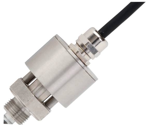
Chave de nível tipo óptico, modelo OLS-5200