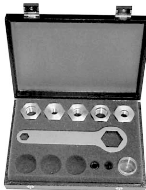
Adapterset im Werkzeug-Etui