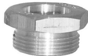
Gewindeeinsatz mit Innengewinde für Rändelmutter M28 x 1,5

*) Für diese Gewindeeinsätze wird untenstehender Dichteinsatz zur Aufnahme in die Rändelmutter M28 x 1,5 benötigt.