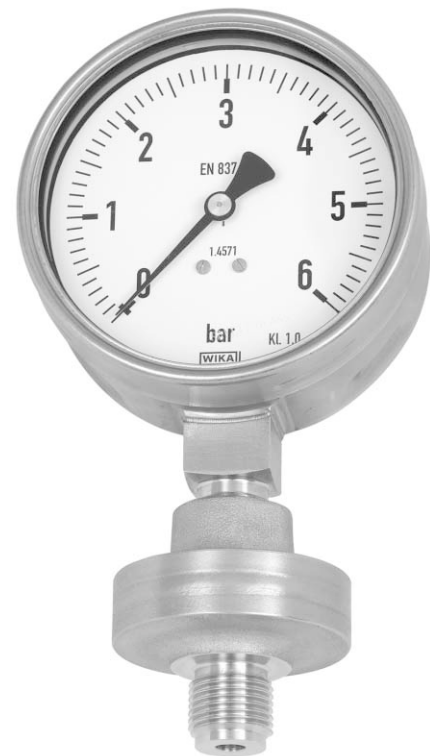
Séparateur, concept monobloc soudé type 990.38 avec manomètre type 232.50 diamètre 100