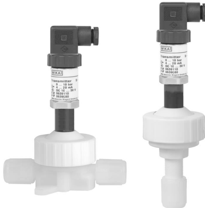
HYDRA-Sensor in-line flare