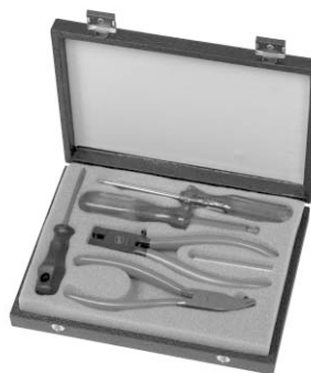
Werkzeugset für CTS-Messwerk