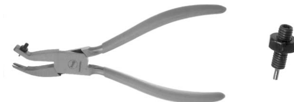
Abb. links: Zeigerabhebezange für Geräte ohne elektrische Zusatzeinrichtung Abb. rechts: Ersatzstift