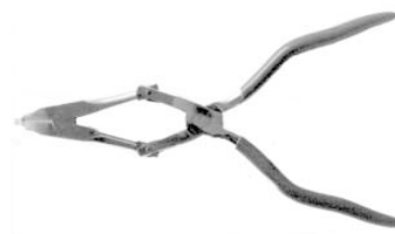
Justagezange für Zugstangenaugenspreizen

Spezialwerkzeuge zum Justieren von Druckmessgeräten