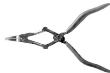
Justagezange für Segmentmutter verschieben