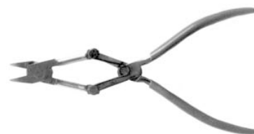
Justagezange für Zugstangenaugenzusammendrücken